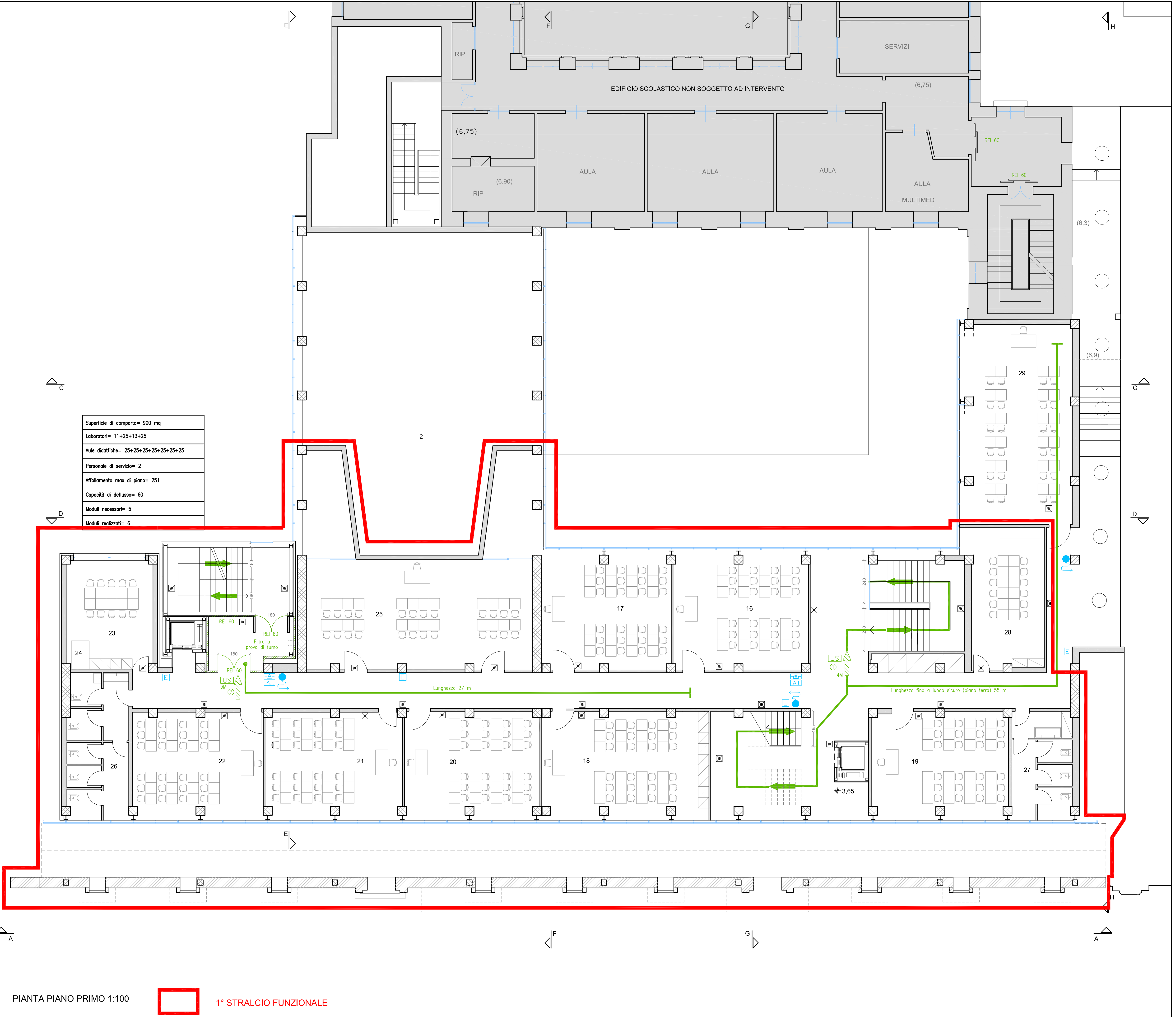
PIANTA PIANO PRIMO 1:100 1° STRALCIO FUNZIONALE